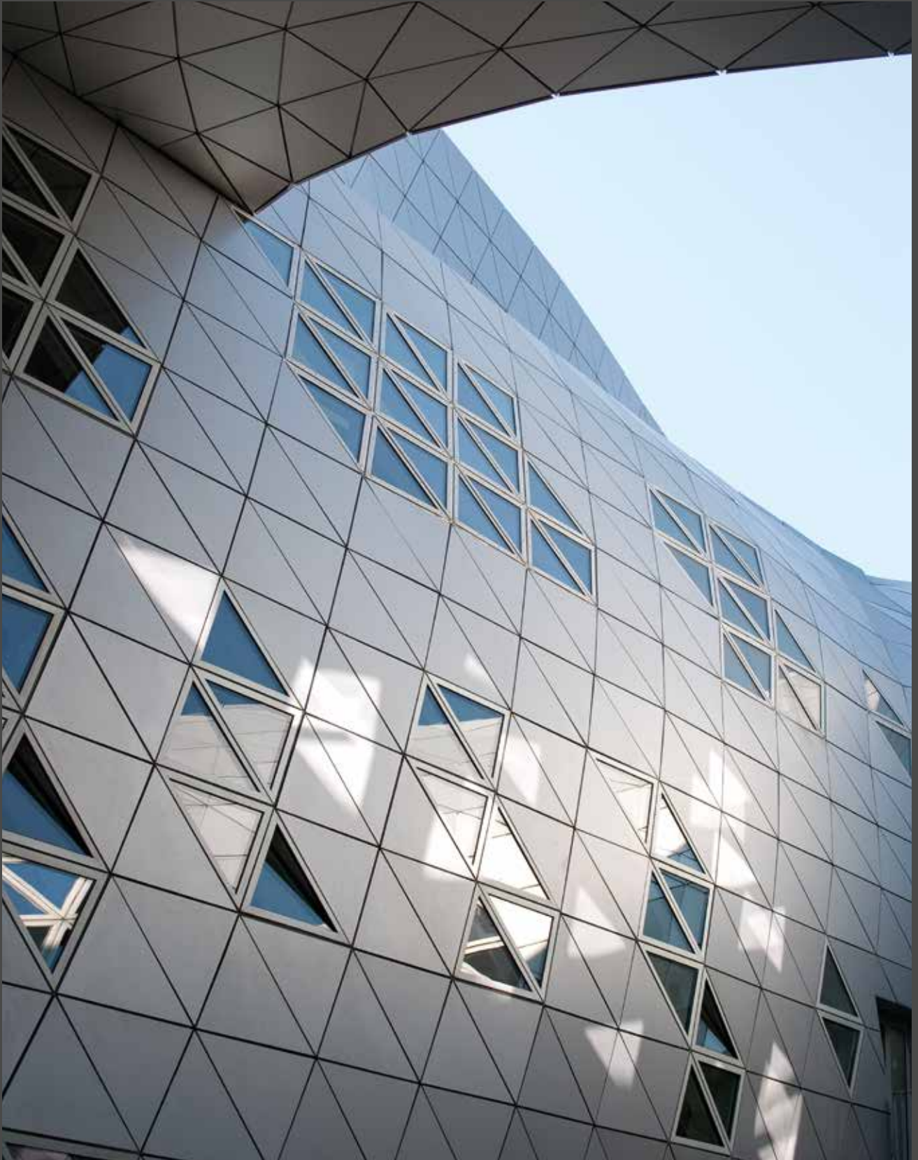
Lycée Georges Frêche, Frankreich | Architekt: Massimiliano und Doriana Fuksas, Rom, Paris | Verarbeiter: Tim Composites, SMAC Toulouse Material: ALUCOBOND® anodized look C0/EV1