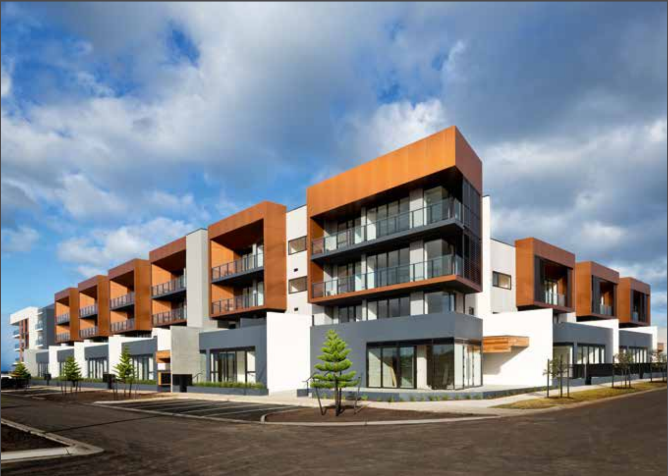
Wyndham Harbour, Australia | Architect: Fender Katsalidis | Material: ALUCOBOND® PLUS naturAL Copper