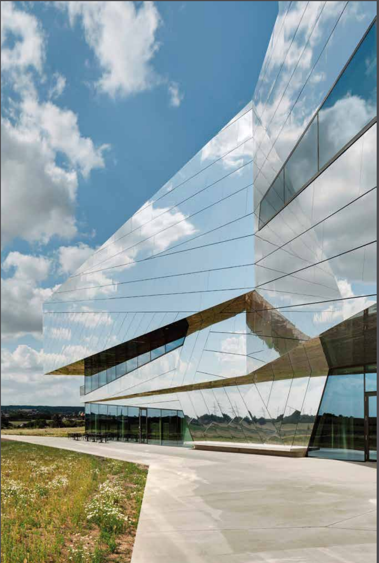
Paläon, Schöningen, Germany | Architects: Holzer Kobler Architekturen Zürich, PBR Magdeburg | Material: ALUCOBOND® PLUS naturAL Reflect