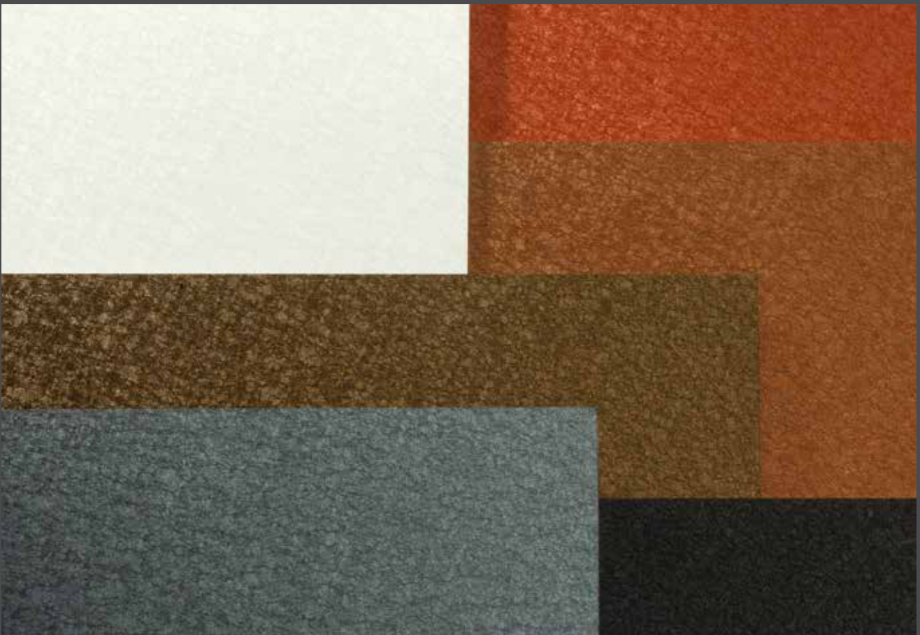
Characteristic of ALUCOBOND® terra is the crystalline matt sheen of the surface which changes with the light. | Charakteristisch für ALUCOBOND® terra ist die kristalline Oberfläche, deren Farbigkeit mit dem Lichteinfall matt changiert.

Beständigkeit, Ursprünglichkeit und Wertigkeit, dafür stehen Steine und Kristalle. Sie zaubern lebendige Lichtreflexe und überraschen mit unterschiedlicher Haptik von rau bis glatt. ALUCOBOND® terra ist inspiriert vom Schillern der Gesteine. Die Oberflächen der Dekore brechen das Tageslicht mit mattem Schimmer und zaubern so mal eine elegante, mal eine erdig changierende Farbigkeit. ALUCOBOND® terra verbindet die für Steinplatten typische, kristalline Oberfläche und samtige Haptik mit vielen Vorteilen der ALUCOBOND®-Verbundplatten: Anders als die meisten Natursteinplatten sind ALUCOBOND®-Verbundplatten sehr dünn und leicht, haben aber gleichzeitig eine hohe Biegesteifigkeit sowie Bruchfestigkeit. Große Plattenformate lassen sich einfach und passgenau herstellen, bearbeiten, transportieren, montieren sowie durch Abkanten und Rundbiegen mehrdimensional verformen. Dazu weist ALUCOBOND® terra, im Gegensatz zu vielen Steinoberflächen, eine sehr hohe Witterungs- und Farbbeständigkeit auf.