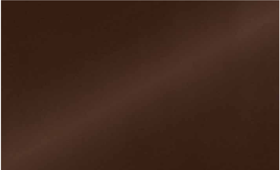
DE-AM0350 Mill Copper 50