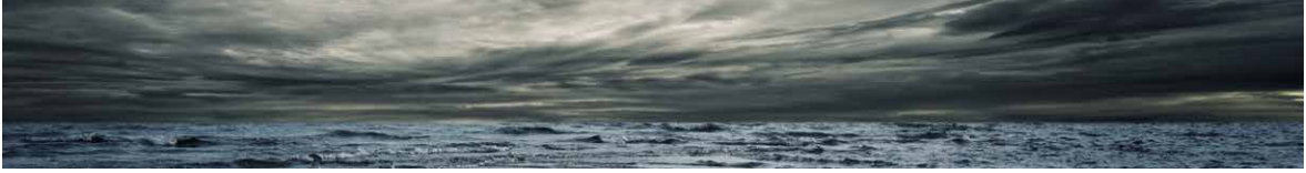
DE-AM0102 Mill Natural