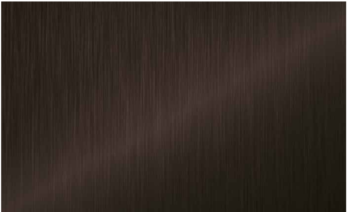
DE-AB0480 Brushed Bronze 80