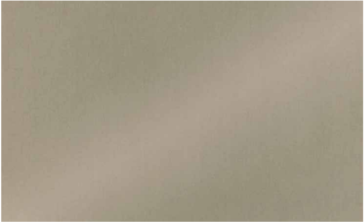
DE-AM0430 Mill Bronze 30