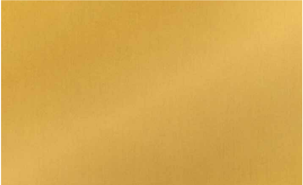
DE-AM0240 Mill Gold 40